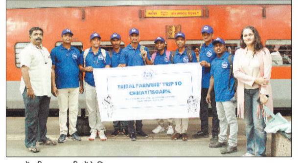
उत्पादों की जानकारी लेगे किसान।

मुंबई स्थित शॉप फॉर चेंज फेयर ट्रेड एनजीओ एवं जिला प्रशासन के संयुक्त तत्वाधान में महाराष्ट्र राज्य के आठ स्थानीय उत्पादों एवं प्रसंस्करण की कि सा न लेगें जानकारी 02 से 06 अप्रैल 2024 तक जशपुर जिले में प्रवास पर रहेंगे।