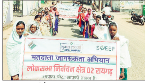
मतदाता जागरूकता रैली।

मतदाता जागरूकता अभियान के तहत जिले भर में विभिन्न कार्यक्रम आयोजित किए जा रहे हैं। इसी कड़ी में जशपुर शहर, कुनकुरी सहित अन्य निकाय एवं ग्रामीण क्षेत्रों में मतदाता जागरूकता कार्यक्रम आयोजित किया गया।