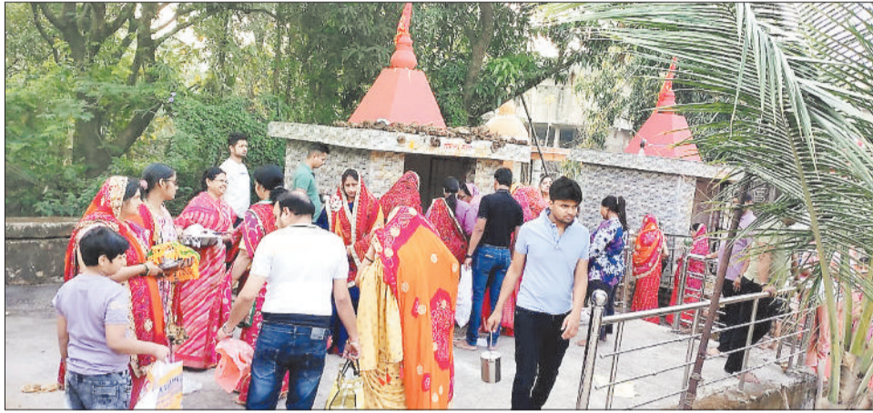
माता शीतल की पूजा के लिए लगी कतारें।

हरिभूमि न्यूज ▶▶ पत्थलगांव मारवाड़ी समाज के लोगों ने माता शीतला की पूजा अर्चना की।