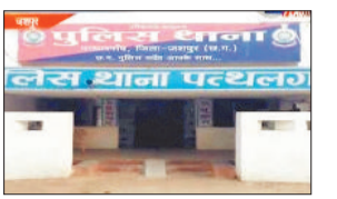
करते हुए सभी चार आरोपियों को पुलिस ने पकड़ लिया है। जिसमें से दो बालिग और दो नाबालिग है थाने में एफआईआर की जा रही है।

पत्थलगांव। पुलिस ने 10 घण्टे के अंदर टीम बनाकर तीन नाबालिग लड़कियों के साथ दुष्कर्म करने वाले सभी बालिग और नाबालिग आरोपियों को पुलिस ने पकड़ लिया है।